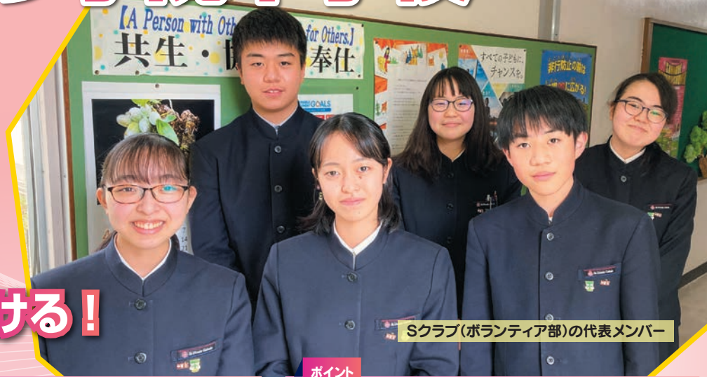
Sクラブ(ボランティア部)の代表メンバー