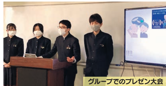
グループでのプレゼン大会

国語や総合的な学習の時間等では思考力や表現力を伸ばす機会がたくさん!ポスターセッション、ビブリオバトル、調べ学習の発表を通してプレゼンテーションスキルを磨きます。